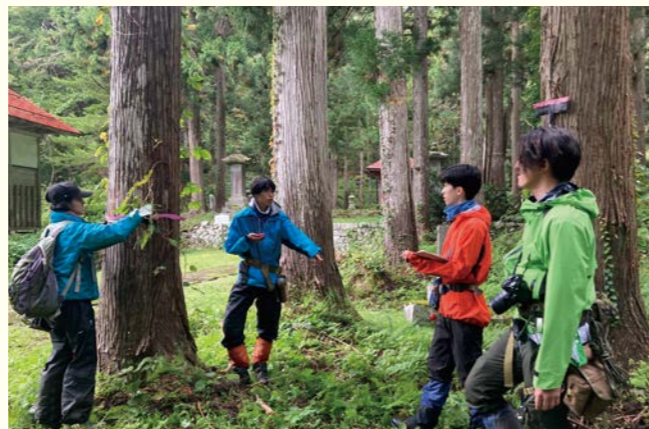
助成先の活動の様子

また、助成している保全活動や研究の中には、水田における生物多様性の保全に関わるものも多く含まれます。そのため、同ファンドの取り組みは、当社にとって重要な調達物である米と自然との関わりに関する知見の蓄積にもつながっており、当社事業にとっても重要なものになっています。