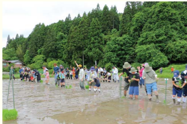
田んぼの学校の様子

こうした活動を通して、水田の生物多様性保全の重要性を社会に伝え、環境保全の意識の醸成を図るとともに、当社としても重要な調達物である米と自然に関する知見の蓄積にもつながっています。