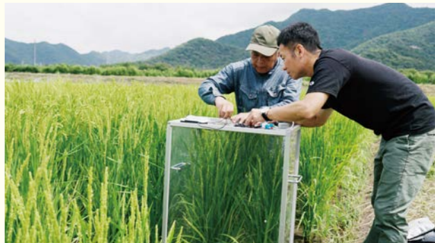
圃場での環境配慮の取り組み実施の様子

「然土」の原料となる山田錦の生産では、環境負荷に配慮した取り組みを行っています。中干期間の延長や稲わら腐熟促進資材(微生物)の活用などにより、稲作時に発生するメタンガスを抑制しています。また、あわせて圃場の生物多様性を維持するため、減農薬にも取り組んでいます。