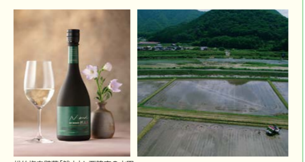
松竹梅白壁蔵「然土」と西脇市の水田

「然土」の原材料となる山田錦については、兵庫県西脇市で篤農家と協働して米作りをしています。この水田は、県によって保護地域に指定された森林、ため池、河川などに囲まれており、土地利用の多様性が高い里山生態系に位置し、多くの生物が生息していると考えられます。