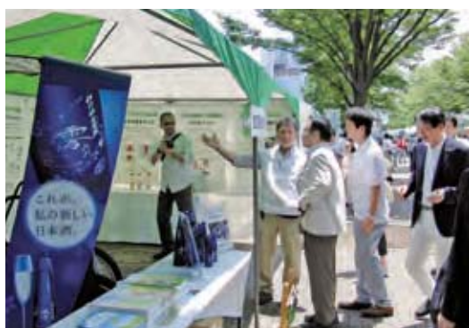
望月義夫環境大臣(当時)に宝酒造の環境活動を説明

2015年6月に開催された環境省主催「エコライフ・フェア2015」に初めて協賛出展しました。当社の空容器問題への取り組みや宝酒造「田んぼの学校」、「エコの学校」の環境教育、タカラ・ハーモニストファンドなどの取り組みを紹介しました。