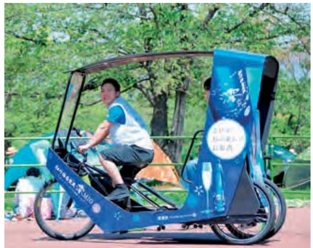
開発に協賛した国産のペロタクシー