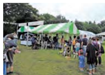
宝酒造展示ブースの様子

2015年4月に開催された「第23回ロハスフェスタin万博公園」に協賛出展しました。当日は好天に恵まれ会場には約88,000人の来場者があり、当社の展示ブースにも約2,000人の来場がありました。また、9月に開催された「第6回ロハスフェスタin東京・光が丘公園」にも協賛出展しました。やや不安定な天気でしたが会場には約52,000人の来場があり、当社の展示ブースにも約1,600人の方々に来ていただきました。