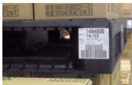
パレットに貼付したバーコードによる製品情報管理

物流センターでは、パレットごとに貼付したバーコードによって、製造ライン、製造日時などの情報を管理しています。製造履歴を管理することで商品の品質情報を迅速に確認できる体制を整えています。