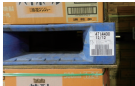
パレットに貼付したバーコードによる製品情報管理

物流センターでは、パレットごとに貼付したバーコードによって、製造ライン、製造日時などの情報を管理しています。製造履歴を管理することで商品の品質情報を迅速に確認できる体制を整えています。