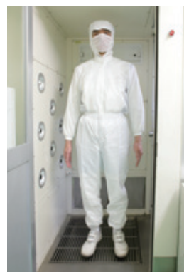
エアシャワー室での異物除去