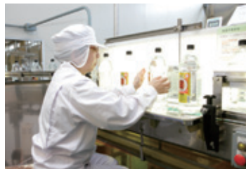
検査員による充填後の目視検査

充填後は、自動検査装置による異物検査や印字検査、検査員による目視検査や官能検査、最新の分析装置を利用した成分分析を実施して、商品の安全と品質を確保しています。