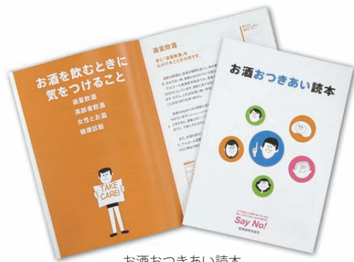
お酒おつきあい読本

さらに2009年にはこれを増補・リニューアルした「お酒おつきあい読本」を発行し、適正飲酒を呼びかけています。この冊子をさまざまなイベント等でご提供しているほか、同内容を宝酒造ホームページでも公開しています。