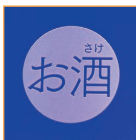
お酒マークの表示の例