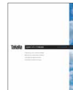
アニュアルレポート