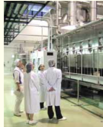
3人のレポーターが「白壁蔵」を見学