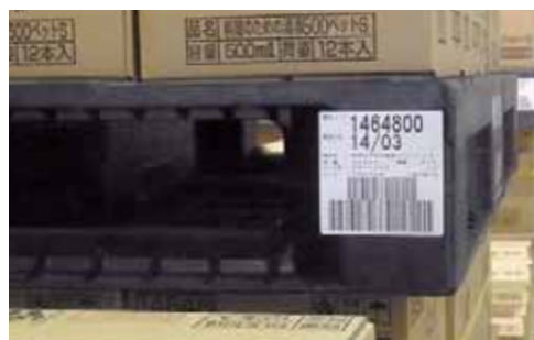
パレットに貼付したバーコードによる製品情報管理

物流センターでは、パレットごとに貼付したバーコードによって、製造ライン、製造日時などの情報を管理しています。製造履歴を管理することで商品の品質情報を迅速に確認できる体制を整えています。