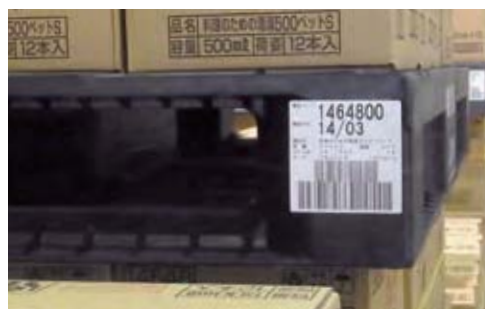
パレットに貼付したバーコードによる製品情報管理

物流センターでは、パレットごとに貼付したバーコードによって、製造ライン、製造日時などの情報を管理しています。製造履歴を管理することで商品の品質情報を迅速に確認できる体制を整えています。