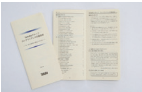
コンプライアンス行動指針

社員一人ひとりがどのように行動すべきかを「TaKaRaグループコンプライアンス行動指針」を制定し、守るべき基本的な行動ルールをいつでも確認できるように小冊子を作成し全員に配付しています。また、内容についてはコンプライアンス委員会で、適宜見直しを行っています。