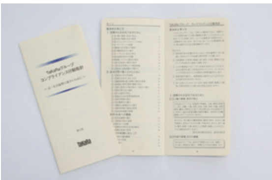
コンプライアンス行動指針

社員一人ひとりがどのように行動すべきかを「TaKaRaグループコンプライアンス行動指針」を制定し、守るべき基本的な行動ルールをいつでも確認できるように小冊子を作成し全員に配付しています。また、内容についてはコンプライアンス委員会で、適宜見直しを行っています。