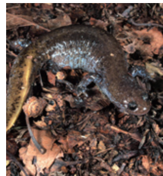
カスミサンショウウオ