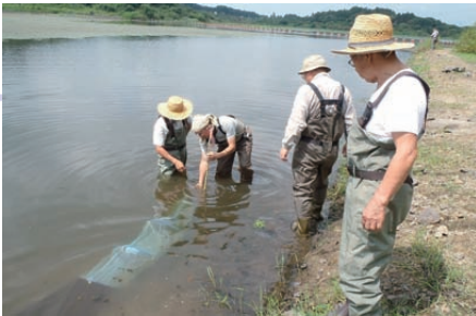
外来魚駆除による 保全活動のための調査研究