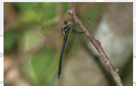
小笠原の固有トンボ類再生、 保全のための活動