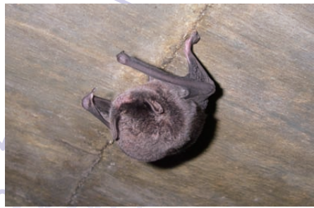
四国西南地域における ユビナガコウモリの休息場利用状況 および集団構成の把握