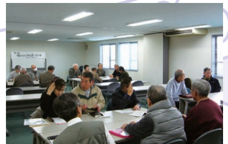
琵琶湖・淀川水系、環境保全 「川の清掃・流域一覧地図」の制作