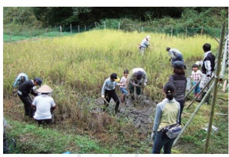
鹿背山の里地里山を守り育てる活動