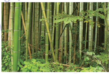
放置竹林問題についての 実践的啓蒙活動