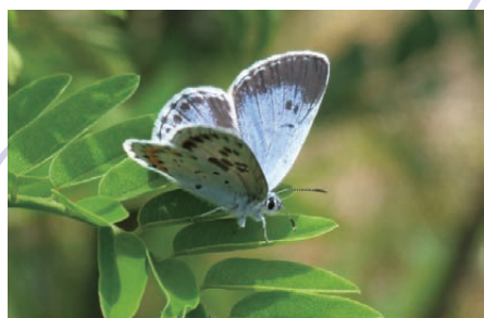
長野県安曇野のオオルリシジミ保護と 住民への普及活動