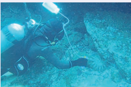
サンゴ保全にかかる普及啓発及び 調査活動