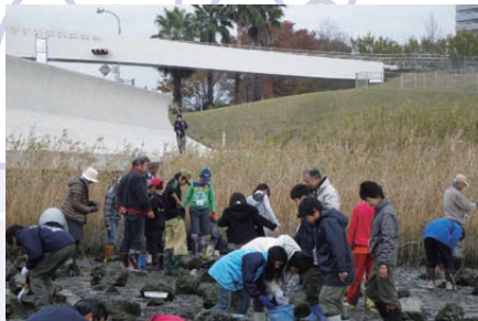
河口ヨシ原保全のための啓発活動