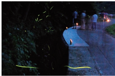
みしまのホタルをそ〜っと見守る 里山保全活動