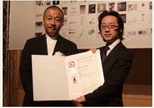
2009年度グッドデザイン賞表彰式

グッドデザイン賞は、(財)日本産業デザイン振興会が主催する、日本で唯一の総合的なデザイン評価・推奨制度で、世界有数の歴史と実施規模を誇っています。今回の受賞では、「伝統の技と現代の技術の融合」という白壁蔵のコンセプト、「オンテーブルで食事とともに楽しむ」という飲用シーンに配慮したデザインが評価されました。