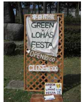
グリーンロハスフェスタの看板

宝酒造では、当日のスタンプラリーとして使用される絵はがきの紙に、酒パックをリサイクルしたものを提供しました。