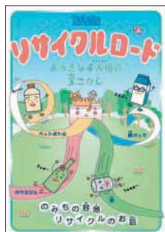
TaKaRa リサイクルロード

NPO法人日本環境倶楽部と共同で作成した飲み物容器のリサイクル啓発絵本「TaKaRa リサイクルロード」を最新の内容にリニューアルしました。全国の小中学校の希望者や、エコプロダクツ展などの環境イベントにおいて、無料配布しています。なお、この冊子は京都エコポイントモデル事業でカーボンオフセットされた電力を使用して印刷しています。