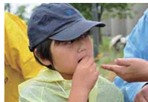
コバンソウの実の味を確かめてみる