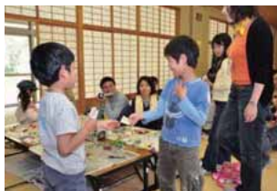
草花名刺を使って自己紹介

(例) 草花名刺で自己紹介 自己紹介のあとの授業では、参加者同士の会話がはずむようになります。