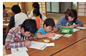
感じたことを絵や文章にする