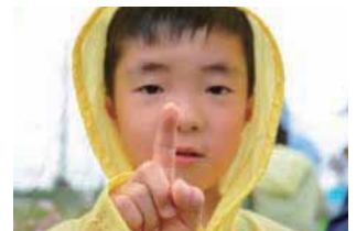
ネバネバする花粉を指先にとってみる