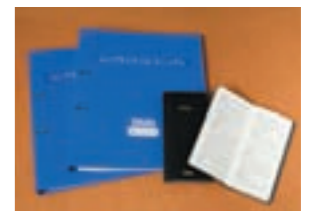
コンプライアンス・マニュアル

社員一人ひとりがどのように行動すべきかを「コンプライアンス・マニュアル」にわかりやすくまとめ、ファイルや手帳、小冊子などの形で全員に配付しています。