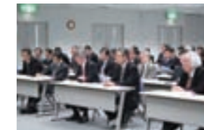
コンプライアンス・トップセミナー