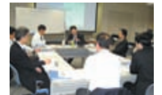
コンプライアンスリーダー研修