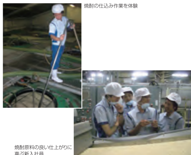
焼酎の仕込み作業を体験

社会人への意識の切り替えを目的とした体験学習をはじめ、会社の経営・人事・事業に関する各種講義により、会社や業界に対する理解を深めます。また、語学研修、人権学習、マナー研修、OA研修などを通じて、社会人、企業人として必要な基礎知識を学びます。導入研修は事務職、技術職共通で実施します。