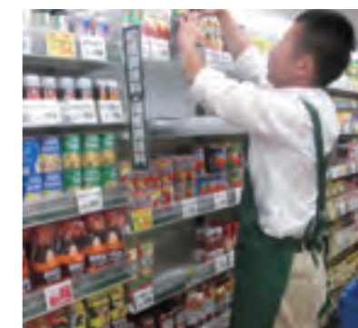
スーパーマーケットでの商品陳列

お客様のご協力のもと実際にスーパーマーケットの売場に立ち、店舗の方々へ指導していただきながら、品出しや陳列、試食販売、店頭販売などの仕事を体験します。お客様の視点や、お客様であるスーパーマーケットの業務を徹底的に学び、現場に密着した提案のできるセールスをめざします。