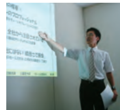
学んだ成果をプレゼンテーション

支社の先輩社員に同行し、直接取引先と接しながら営業の基本を学びます。実際の営業活動を体験する中で営業に必要な能力やスキルを明確にし、市場の現状を客観的に分析する力を養います。