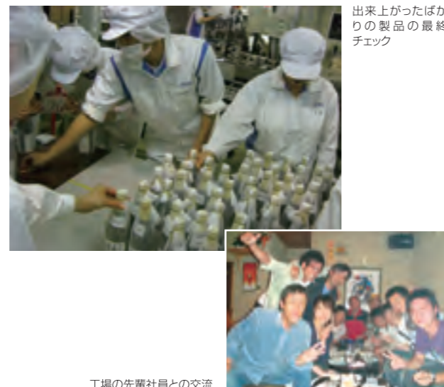
出来上がったばかりの製品の最終チェック

自社工場で、焼酎・清酒・チューハイ・みりんの製造工程を実際に体験し、つくりの知識や自社技術を深く理解します。ものづくりの大切さを学び、つくり手の想いを感じることで、商品への愛着、メーカーとしての誇りやプロ意識を育てます。