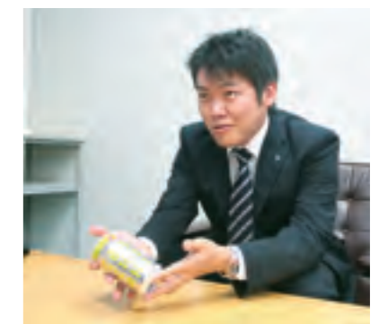
商談を意識したプレゼンテーション演習

プレゼンテーションやスピーチ練習などの社員研修、グループワークを通じて、基本スキルの向上や幅広い知識を習得します。また、2008年度は、お酒のつくりを中心とした研修ハンドブックの製作を行いました。知識を吸収するだけでなく、アウトプットを求め、現場に密着した提案のできるのがTaKaRaの研修スタイルです。