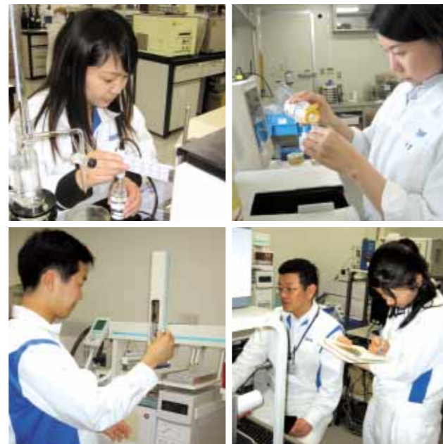
技術者が分析を行い、品質に関するデータを蓄積します。

その後、商品の品質規格や製造工程について審査し承認されると工場での生産が可能となります。