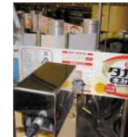
【印字検査】 タカラ本みりんペット製品は、ラベルに記載している賞味期限をカメラにより全数検査しています。

原料受入から出荷にいたるまで、品質検査に合格したもののだけが次工程に進み、最終検査を経て出荷されます。自動検査装置による異物検査や印字検査、検査員による目視検査や官能検査、最新の分析装置を利用した成分分析を実施して、商品の安全と品質の確保に努めています。