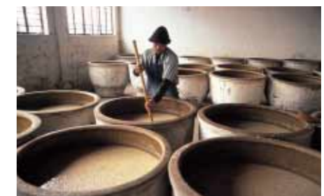
紹興酒の仕込み作業