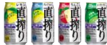
タカラCANチューハイ「直搾り」

私は、チューハイなど低アルコール飲料の企画・開発を担当しています。3月に新発売した「直搾り」では、私たちスタッフが果樹園や果汁搾汁工場のある産地に出向き、使用する果汁の品質や製造工程を確認しました。特に「直搾り」は、「ストレート混濁果汁」という果汁にこだわった商品なので、果汁の安心・安全なおいしさをお客様にお届けするため厳しいチェックのもと商品開発を行いました。