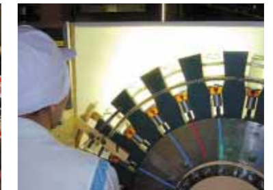
【目視検査】 松竹梅びんカップ製品は、容器を回転させ、液もれや容器のキズなどがいないかを検査員が目視で検査しています。