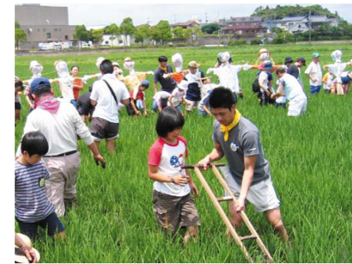
参加者をサポートする当社社員(黄色いリボン着用)

宝酒造では新入社員研修のプログラムに環境教育を組み込んでいることをはじめとして、毎年ISO14001に基づく環境教育を実施しています。また、TaKaRaグループ報に環境に関する情報を掲載したり、「お米とお酒の学校」を社員ボランティアで運営するなど、社員への環境啓発に力を入れています。