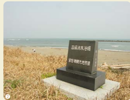
①黒壁蔵の向かい側にあるグラウンド。地元の少年野球チームが元気に練習する姿が見られます②③④地元の人々に愛される蚊口海岸。美しい砂浜と青い海を守るために毎年クリーン活動を行っています

黒壁蔵は50年以上もこの高鍋で酒造りをしています。それだけに地域の人々との交流も深く、グラウンドの無料貸し出しや、中学校や高校のインターンシップ受け入れなど、積極的に地域に根ざした活動を行っています。また毎年宝酒造の創立記念日には宝酒造労働組合が「地球びかびか大作戦」を実施しており、黒壁蔵では社員やその家族が参加して近くの蚊口海岸を清掃し景観美化に努めています。