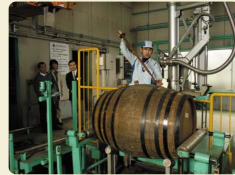
貯蔵熟成酒をテイasting