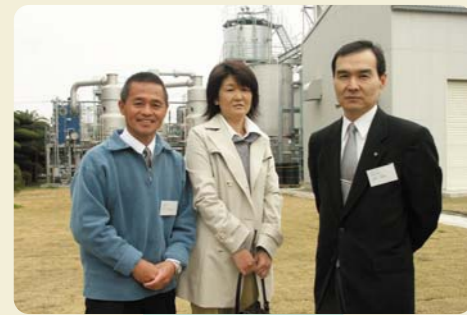
ご参加いただいた方々