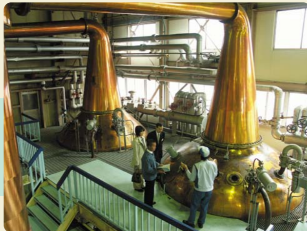
蒸留室にある単式蒸留機「ポットスチル」