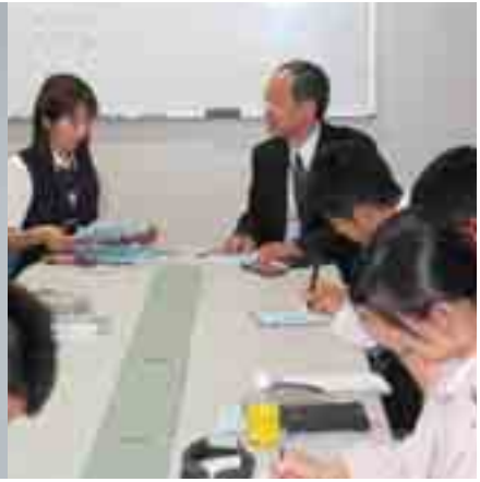
新入社員への環境教育