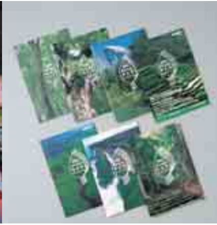
1998年から2004年までの緑字決算報告書