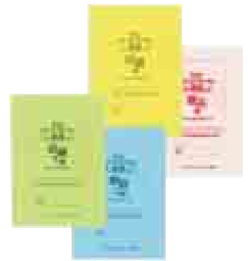
参加者に配布されるしおり