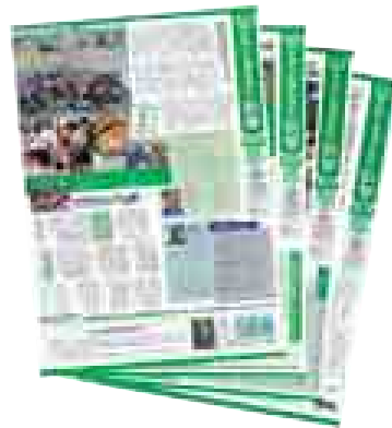
写真やコメントをふんだんにつかって活動の様子を報告する「お米とお酒の学校新聞」