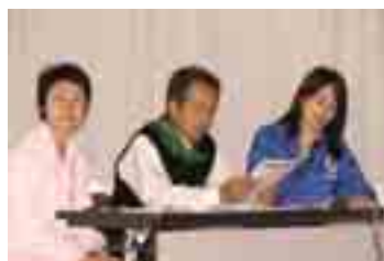
看護士さん(左端)を招いて医学的な立場からのお話しも

これは、アルコールが体におよぼす効果、影響を子供だけでなく大人にも正しく学んでいただき、未成年者飲酒や飲酒運転を防止しようという取り組みで、親子で共に考え学ぶことでお酒についての正しい知識とマナーを身につけていただきたいと考えています。