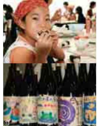
⑦田んぼに入って雑草取り。⑧⑨かかしづくりに挑戦。力作が勢ぞろい！⑩昔ながらの農具を使って脱穀。⑪みんなの努力で見事に実った稲穂。⑫「おいしい〜」自分たちでつくったお米の味は格別。⑬子どもたちがラベルを手作りした、世界でたったひとつのお酒。お父さんお母さん大事に飲んでね！

2004年に引き続き、2005年度も首都圏を中心に約2,000人もの応募があり、約100名のご家族が4月から始まった「TaKaRaお米とお酒の学校 2005」に参加しています。