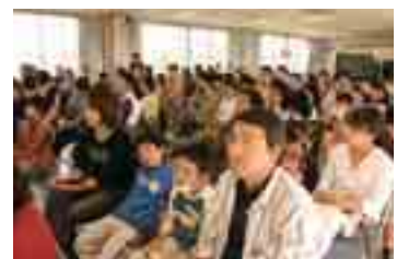
大人も子供も真剣に耳を傾けました