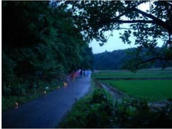
当日の会場の様子