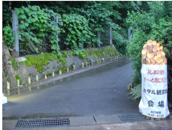
告知看板の設置状況