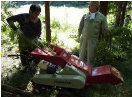
破碎機でチップ化