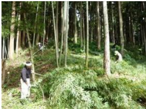
可能な限り竹を伐採