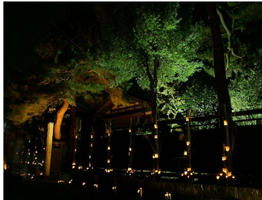
越後みしま 竹あかり街道