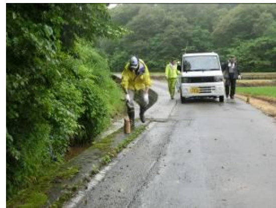
竹灯籠撤去、清掃作業