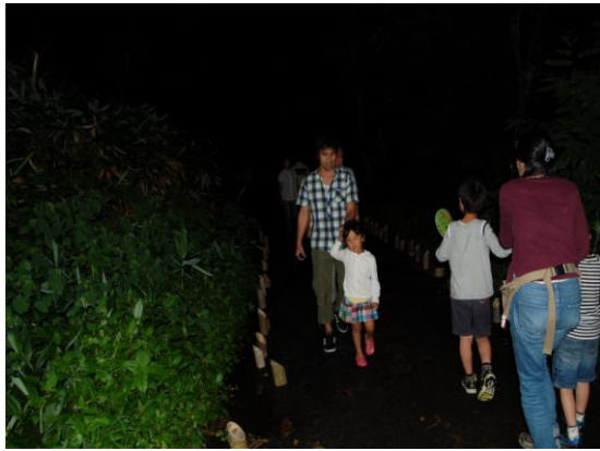
当日の会場の様子