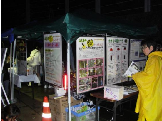
パネル掲示、パンフ配布