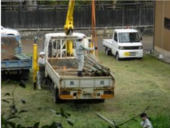
竹の積み込み・運搬状況