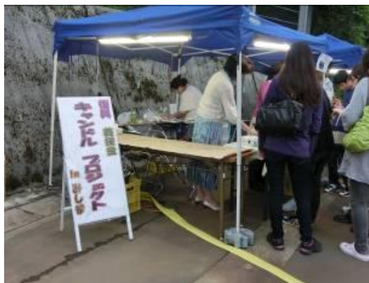
キャンドルプロジェクト賑わい状況