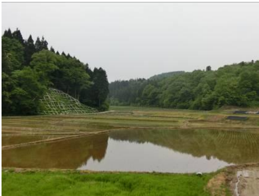
里山保全の活動区域

活動の舞台となる新潟県長岡市三島地域は、面積の約 6 割が森林という緑豊かな地域で、蛍が一種類生息するだけでも自然環境が良いと言われている中、ゲンジボタルとヘイケボタルが同一地域内で生息している数少ない地域となっている。この地域は里山からの豊富な湧水に恵まれ、それを活かした醸造産業等も発達しているが、近年林内への竹の浸食による荒廃が進み、里山の保全と水源の涵養を行う必要が生じている。このため、竹の伐採により植物相の健全化を図り、里山の再生と水源の保護を目指すとともに、地域住民に現状を知ってもらい、地域全体での持続可能な活動とするため、楽しく参加できる啓発イベントとして蛍の観賞会を実施する。