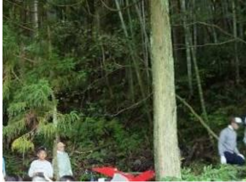
管理放置されている里山