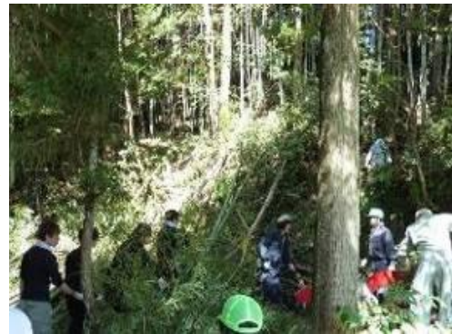
伐採により里山に光が入る