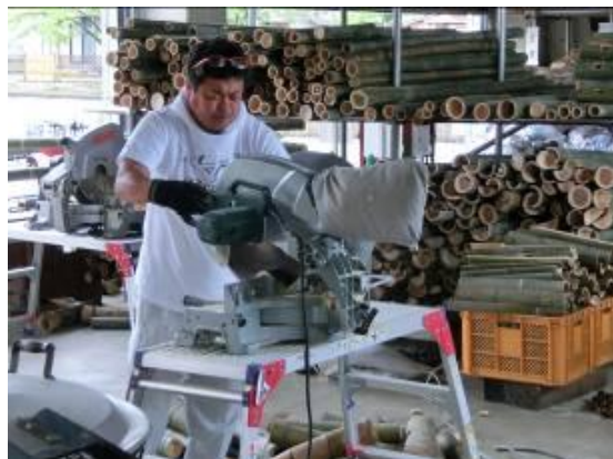
竹あかりイベント状況