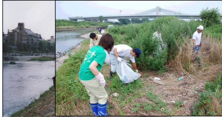
(社員が家族と一緒に清掃：年1回)