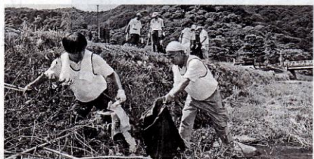
川べりを清掃する市民たち。琵琶湖・淀川水系では多くの住民や団体が清掃活動に取り組んでいる（8月27日、京都市右京区・桂川河川敷）

水環境保全に取り組み琵琶湖・淀川流域圏連携交流会（事務局・大阪市）は、水辺で清掃活動に取り組んでいる市民やグループの情報を集めている。寄せられた情報はインターネット上の地図で公開し、川や湖を大切にすることを広める。