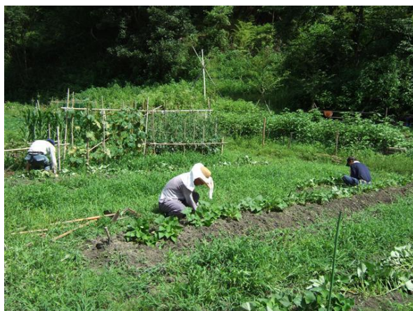
・畑でのサツマイモ畝の除草作業

水田の稲は根付いたようですが、分桔はまだのようです。モグラの穴か、水田の水漏れがあり、仕切り材で塞ぐ処置を行いました。この時期の作業として肥料散布を行いました。畑ではサツマイモやトウモロコシ、キュウリ、トマト畝周りの除草を行いました。