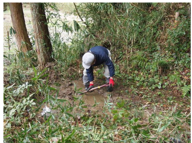
・移設場所の水溜まりづくり

カスミサンショウウオの新しい水溜りづくりを行いました。新しく水田として使用中にあったために専門家の意見を聞いて移設することにしました。隣接して草地と林部があり、湧水が多く出て、常に水量が確保できる場所です。昨年に続き、今年も子供達を対象にして、5月頃に幼生の放流イベントを行う予定です。