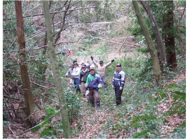
・恵比寿神社への初詣の参道の山道を歩く

畑では春植えの準備として、耕転と畝づくり、施肥（元肥）に併せて石灰も施しました。ミズナ、ハクサイ、ネギの収穫を行い、一部は雑煮（昼食）の食材としました。2月中ごろから春植え野菜の植え付けを行います。