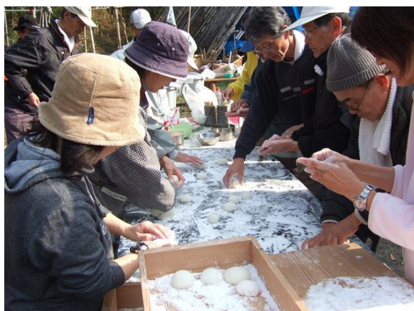
・小餅を作る餅の丸め

を味わうことが出来ました。会員が用意したモモギや紅エビ、サツマイモの3種を入れた餅も作りました。白い餅との彩りがよく、好評でした。予定よりも1時間ほど長くかかりましたが、雨にも降られずに、無事終了することができました。全員で後片付けをして、お餅を手土産に解散しました。