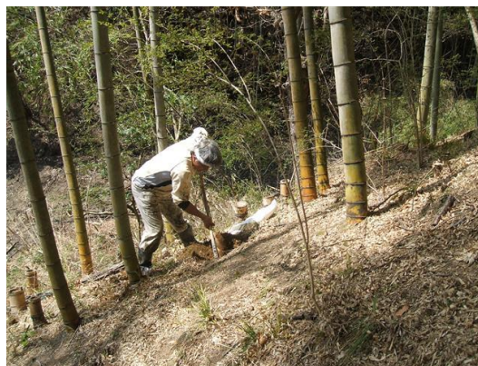
・竹林内でのタケノコの収穫