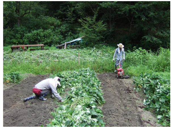
・秋植え準備の耕耘とサツマイモ畝の除草

畑では除草と秋植え野菜の準備の耕耘を行いました。収穫後の畝も雑草が繁茂していました。手作業と鋤で除草を行い、堆肥を施して、耕耘機で耕耘を行いました。活動日前に会員が保管していた干しネギの植え付けを行い、今回、キントキニンジン（キンニン）の播種を行いました。トウモロコシは収穫が間近です。野鳥による食害を防ぐために、防護網を被せました。今年は収穫を楽しむことが出来そうです。サツマイモは暑さに負けずに生育しています。トマトやキュウリ、ナスビは収穫時期が過ぎたようで、成りが少なくなりました。