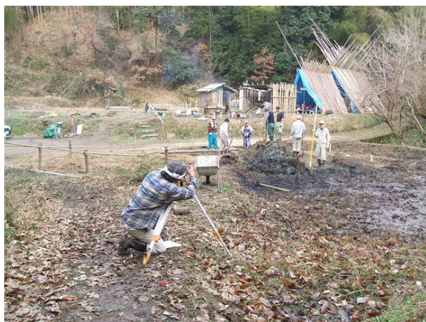
・ビオトープ池づくりの測量

子供達の環境教育や情緒教育の場として、身近に小動物を観察できるビオトープづくりを行っています。鹿背山地区は豊かな自然があり、自然観察には優れた環境です。子供達が自然界の摂理を観察する場づくりが目的です。この地での体験が擬似ではなく、現実であることを知ることから命の大切さと死が後戻りできないことを身をもって体験してほしいと思います。池づくりの掘り作業は機械を使わずに手作業で進めています。重労働で大変ですが、活動を楽しみながら続けていきたいと思っています。作業中に珍しい「タウナギ」が出現しました。冬眠中の様でした。色々な出会いがあるでしょう。これからは導水路づくりや防水シート張り、埋め戻し、植物の移植などを行い、モニタリングをして、記録して行きたいと思っています。