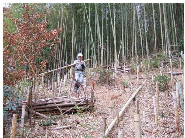
・竹の伐採と切り出し