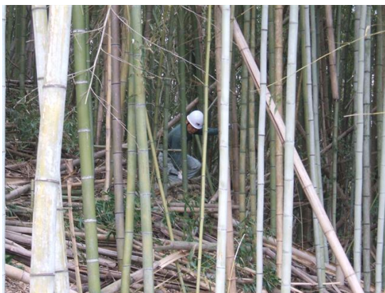
・里山林に異常繁殖した竹藪の間伐活動

鹿背山地区でも放置された田畑やその周辺の森林部に竹や笹類が繁茂蔓延しています。多様な生態系を再生するためには単一の生態系を出現さす竹や笹類の伐採を行う必要があります。皆伐を行った跡地では雑木林の再生のために苗木を移植し、また実生を採取して播種を行っています。良好な里山林を形成することで、多様な生物が生息出来、身近なところでの小動物との触れ合いの場が出来ることを目指しています。一方、整理伐を行うことで食材としてのタケノコの育成や良好な里山景観を創出する竹林の再生を目指しています。