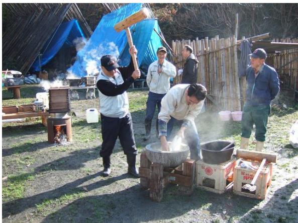
・里山にこだまする掛け声の中での餅つき

餅つきは今冬一番の寒い朝の中で火をおこし、湯を沸すことから始まりました。焚き木材は事前に用意したクヌギや伐採した竹を使用しました。大鉄鍋で湯を沸かし、もち米の蒸し用の窯に火を入れて、蒸し釜の湯を沸かしました。もち米は購入した約30kgで、前日に水とぎをして、浸しておいたものです。蒸しは農家から譲り受けた木製の蒸籠で、竹製のこを敷き、荒めの布巾を重ね、約2キロのもち米を中心部を空けて入れ、3段重ねで行いました。暖めて置いた花崗岩の石臼に蒸籠から蒸し米を入れて、杵で米粒を潰す練りをして、搗きを行いました。杵は会員の手作りで少し重めのものや農家から譲り受けたものを使用しました。餅つきのポイントは杵取りと搗く人との呼吸が合うことです。杵取りは多少経験のある者が自主的に行いました。陽ざしが射しだした里山で、威勢の良い掛け声が響き、搗きが早過ぎたり、タイミングが合わずにヤジが飛ぶ中で、大人に混じり、参加した子供達やお母さん達も杵で搗く楽しい体験をすることが出来たようです。搗きあがった餅は小分けして、あん餅やきな粉餅、大根おろし餅、納豆餅、醤油餅で搗きたて