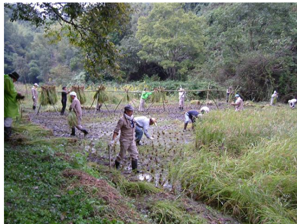
・ 楽しい稲刈りと稲架掛け作業