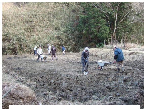
・新しい水田の人力による整地

休憩広場にあったノウゼンカズラの移植をしました。広場を有効に使用したいとの意向によるものです。苦勞して、大きめに植え鉢を掘りましたが、移動時に土が落ちて振るい根状態になりました。山柿のある月見縁台の南側に移植しました。活着するでしょう。