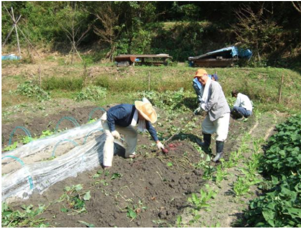
・サツマイモの収穫

新しく耕作予定地の耕運機による耕耘作業を行いました。活動日以外の日にも会員が自主的に草刈りを行ない、廃棄竹やごみ類を焼却して、整備しました。土は透水性も良く、畑土としては適しているようです。