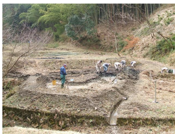
・ビオトープ池の掘削作業