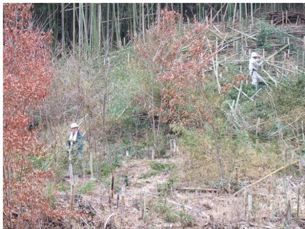
・急斜面地での竹の切り出し