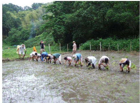
・子供たちも大人と並んで田植え

今回は近くの朱雀小学校（奈良市）のこどもと親4組が参加してくれました。子供達の応援は大いに歓迎です。都市生活では出来ない体験です。子供達の自然との触れ合い体験の機会が少なくなってきました。小さいころからの情緒教育や環境教育が求められており、この里地里山で過ごした時間が役に立てばと思います。これからも親子共々に楽しんでもらえば幸いです。