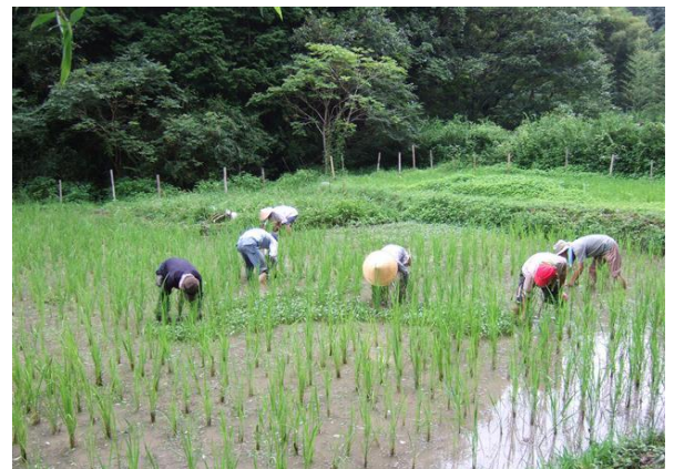
・腰の疲れに耐えての手作業の除草

水田では水草のコナギが異常なほどに繁殖していたために、手作業で草取りを行いました。曇り空の下でしたが、温む水に足を取られて、暑さと腰の疲れに耐えての作業となりました。前回に除草したところも、再度しなければならないほどに水草が生育しているところもありました。稲は分結が遅れていることでコナギが生育し易い条件があるようです。水を抜き、土用干しをすることにしました。