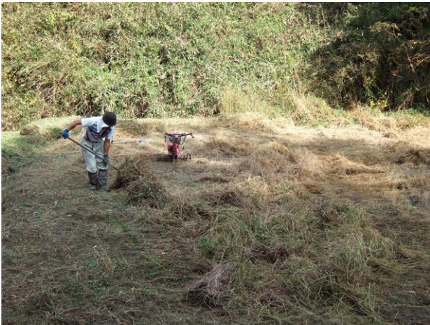
・刈り取った草の集める

林内は雑木林の紅葉も始まり、落葉林の生態を呈してきたことで、色々な種子が芽生えてきています。多様な植生が再生できるように、少しでも拡大していきたいと思えます。