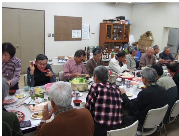
・談笑の中での懇親の忘年会

この1年は楽しく、いい汗をかき、語り合えました。来る年も私たちの活動が地球環境問題や生物の多様性修復への取り組みであることを意識して、続けます。