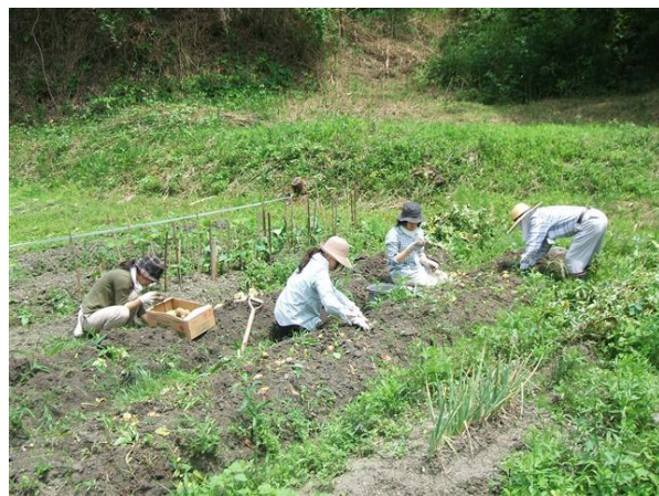
・畑でのジャガイモの収穫