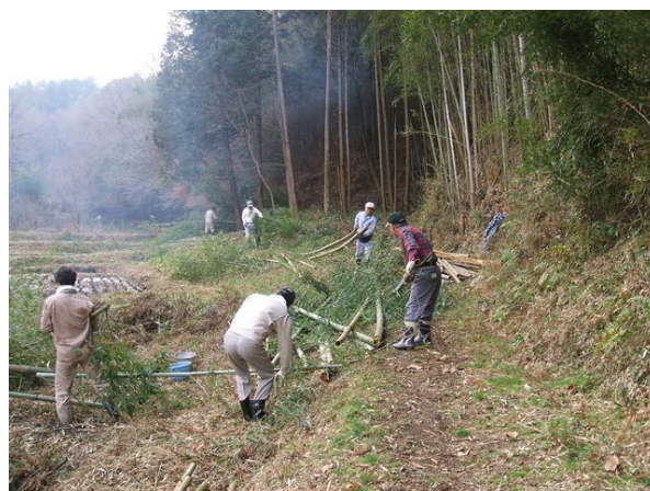
・若者に混じり元気に竹の整備