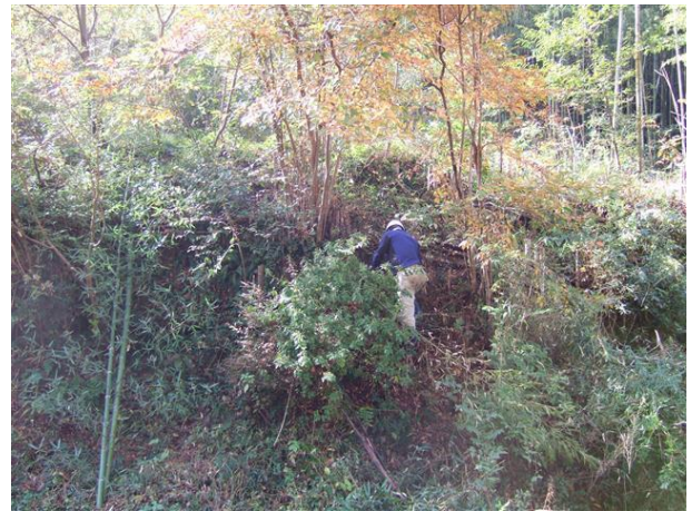
・足場に注意しての急斜面での下草刈り