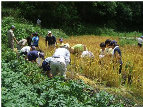
・子供達と共に麦の穂摘み

マメほかで、期待はずれはタマネギ、トマト、トウモロコシなどです。イノシシに荒らされたり、収穫間際に野鳥に食べられたり、無農薬栽培であるために病虫害が多く発生したりして満足いく収穫はできませんが、これも自然との共生体験です。収穫出来たものは昼食時に料理して、楽しんでいます。野菜づくりは経験者の指導が必要です。