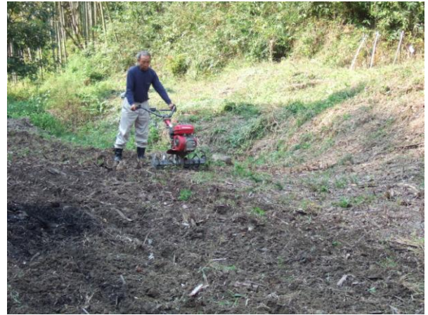
・新しい畑地の耕運機による耕耘

ガマズミの赤い実が映える中で第79回「鹿背山倶楽部活動」(その2)が10月22日（土）に20名の参加で行いました。