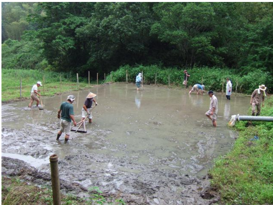
・トンボやレーキほかを使用しての代かき

待ち遠しかった田植えを行いました。しかし、苗床で育てていた稲苗が紋枯病菌？で葉が茶色くなり、使用できなくなりました（育成管理の課題を残しました）。残念でしたが、幸いなことに地元の方から黒米とヒノヒカリ米の稲苗を多く譲り受けることが出来たことで、予定の田植えをすることが出来ました。感謝です。朝から小雨が降る中で十分に溜まっていた水を抜きながら、レーキとトンボで代かきと草取りを行いました。水の感触を楽しむ者や足を取られて、四苦八苦する者もいましたが笑い声が飛び交う中での作業でした。張られた糸の目印のところに植付けていきますが、揃わないのが我が倶楽部の良い所？でもあり短所です。手植えも慣れたもので、約2時間余りで1反ほどの田植えを終えました。今年は事前に会員が準備作業をしていたことで、短い時間で田植えが出来ました。黒米は約2畝ほどでした。