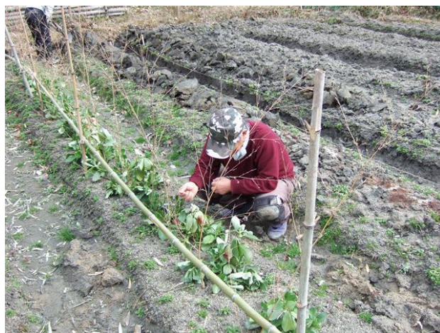
・エンドウ豆の誘引