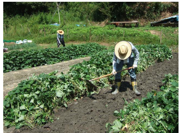
・ダイコン種子の播種前の畝整備