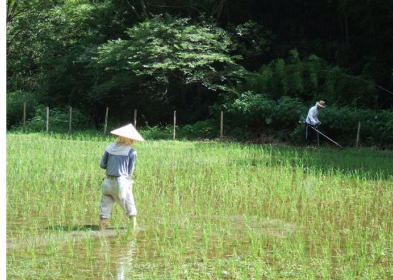
・水田の肥料散布と畦部の機械草刈り

放流したカスミサンショウウオの幼生も水中で確認することが出来ました。泥の中に潜ったり、縁の草陰にいました。少し大きくなったようです。