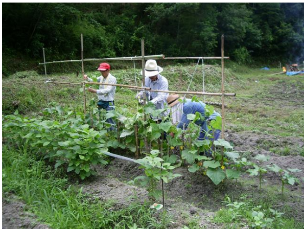
・高齢者も野菜づくりに精を出す

題となっています。働くことを使命とし、趣味を持たずに過ごして来た世代にとっては「第2の新しい人生」に戸惑をもっている人達も多いと思います。職場での緊張生活から開放されて、これからの生活を自然に恵まれた中でスローライフを楽しむのも一つの選択だと思います。私達の活動は多くの人に「里山活動の場」を提供し、参加することで精神的にも、身体的にも健康な潤いのある時間を楽しんでもらうことです。このような人達の里山活動でのニーズは高まっています。しかし、何かをしたいと思っても情報が無い。あってもどうしていいのかわからない人達のために、活動内容をホームページを立ち上げて紹介しています。(ホームページは「鹿背山倶楽部」で検索できます)