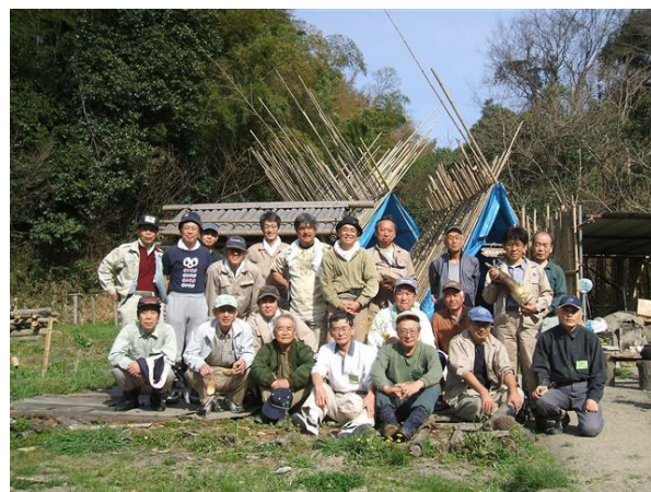
・満足顔で参加者の記念写真