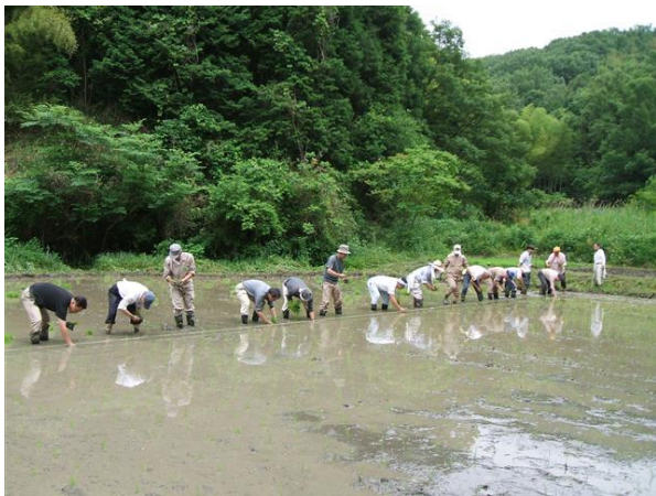
・ 1列に並んでの手作業による田植え

私達の米づくりは農事体験活動です。古代米づくりを行っています。一般には赤米、黒米、緑米の3種が栽培されています。日常に食している米と比べて、それぞれ特徴があります。稲穂の色が赤味や黒紫、濃茶をしています。結穂時の田は里山の彩りを醸し出す一構成要素の役割を十分に発揮しています。籾には長い芒があります。稲丈は長いのが特徴ですが、倒伏対策ほかで品種改良され、日常米品種並みのものが多く用いられています。脱穀した原米は赤味や赤黒、茶味を帯びています。精米すると白くなり、日常米と変わりはありません。糠となる部分に多くの栄養価が含まれているそうです。赤米は「赤飯」、黒米は「おはぎ」の起源と言われています。