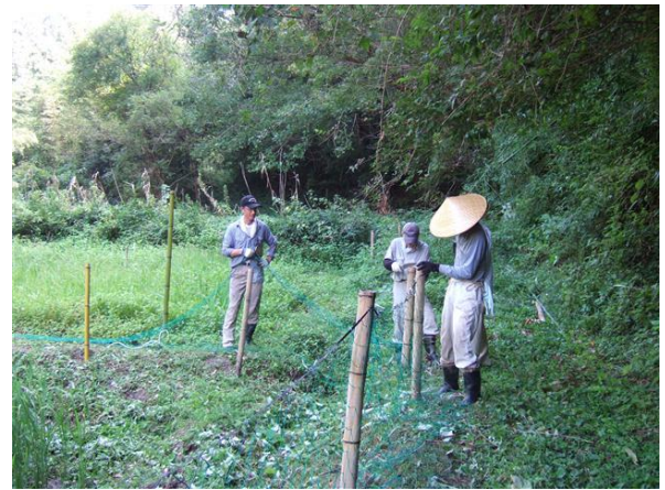
・防護網を敷設（天端をビニール紐で結束）

休憩所周りや畦路沿いの雑草も機械草刈りを行いました。本当に雑草は元気に茂ってきます。会員の方が活動日以外にも自主的に機械草刈りを行っていますが、追いつかず、活動日ごとの大切な作業になっています。