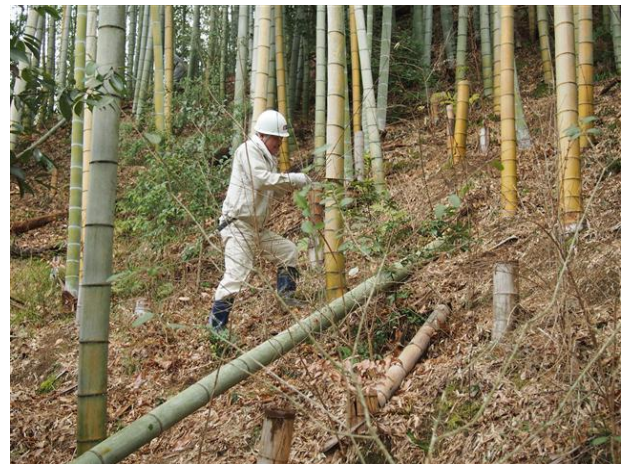
・竹炭づくりのモウソウ竹の切り出し

竹炭を作るためのモウソウ竹の切り出しを行いました。モウソウ竹林が急斜面にあるために、フィールドスパイクを装着して、注意して行いました。伐採後に広場に運び、枝払いをして、径10cm以上の部分を約80cmの倍数の長さで玉切りをしました。これから、80cmに切り揃えて、縦に4～6分割し、乾燥させて、活動日に朝から火入れをして、炭焼きを行いたいと思います。竹炭を使う用途は色々ですが、燃料や水の浄化、消臭乾燥材に使用することが出来ます。また、ご飯を炊く時に入れておくと美味しいご飯が出来ると言われています。会員やイベントの来客者に配布します。