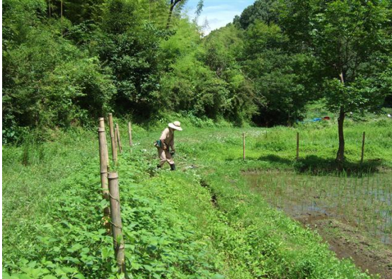
・よく伸びた水田横の雑草の機械草刈り

繁茂した雑草の機械草刈りを行いました。草刈機の刈り刃を全て新しいものを使用して、休憩所周りや水田への畦路沿い、新しく畑地として使用する予定地を行いました。約50CMに生長した雑草の刈り取りは一苦勞でした。活動範囲の足元周りの雑草刈りは小動物や有害動物との棲み分けから、欠かすことの出来ないこの時期の作業です。