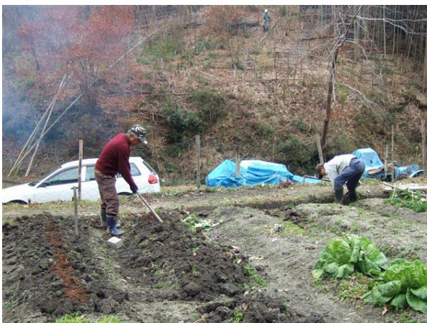
・畑の施肥と畝作りと溝掘り

昼食は正月の祝い膳として、雑煮とちらし寿司でした。雑煮は焼き切り餅に鶏肉、収穫したハクサイとダイコン、シイタケ、コイモ、ニンジン、紅白蒲鉾の切り身でした。ちらし寿司は紅エビにちりめんジャコ、シラス、オオバにシャケフレーク掛けでした。穏やかな里山での正月の宴の祝膳でした。