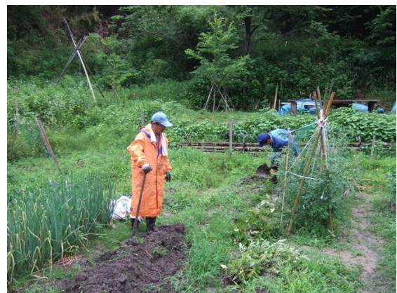
・ジャガイモ収穫後の耕耘と除草

畦路の機械草刈りも行いました。時間が許す限りの活動となりましたが、繁茂した雑草との戦いをこれからも、続けたいと思います。