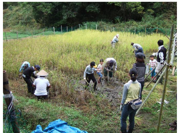
・母親が見守る中で子供達も稲刈り

秋の収穫の楽しみでもある稲刈りを行いました。前夜の雨で足元がぬかるみ、稲も雨に濡れて、作業は一苦勞でした。昨年はイノシシ被害にあったために、防護柵を何度も補強したことで最小限に留めることが出来たようです。刈り取る前の作業として、稲架用の竹材を切り出し、枝を切り落として、支柱と渡し横材を作りました。支柱は3本組として、2つの水田の間の比較的広い畦に2列で組み立てました。さて、稲刈りです。水田内は一部に水溜りがあり、長靴を吐いての作業となりました。今回は田植えにも参加してくれた奈良の小学生の親子4組や会員の子供も参加しての活動となり、和やかで笑い声が聞こえる中での稲刈りとなりました。刈った稲は揃えて、干しわらや紐で結束しました。稲架に掛ける作業は稲が濡れていたことで、手元や服が濡れての作業でした。無事に今年の稲刈りも終わることが出来ました。脱穀と籾摺りは地元の方の協力を得て、11月の活動日に行う予定です。