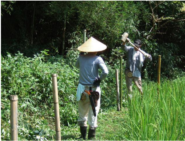
・水田畦の竹杭の打ち込み

水田の稲は結実しています。黒米は稲穂が下垂し始めていますが、ヒノヒカリ米は、まだ直立状態です。ところが、黒米の一部に獣（イノシシか？）が進入した足跡があり、踏み倒されていました。去年は獣害のために収穫が激減しました。味を覚えたことで早々に出現した可能性があり、急遽、次回の活動日に予定していた防護柵を設置することにしました。水田周りの畦部の雑草を刈り取り、古い竹杭の取替えや囲いの範囲を変更したことで新しく竹杭の設置をしました。巻いて保管していた防護網を出入り口部を基点にして、順次巻き戻しながら1周しました。竹杭と防護網は杭の上部に切り目を入れたところに、網の上に通したビニール親紐と網の一部を挟んで結束しました。地際部もビニール紐で杭に結束し、弛みのある部分については半割り竹を打ち込んで進入を防ぐ処置を行いました。しばらく様子を見て、進入の痕跡があれば即に対処したいと思います。