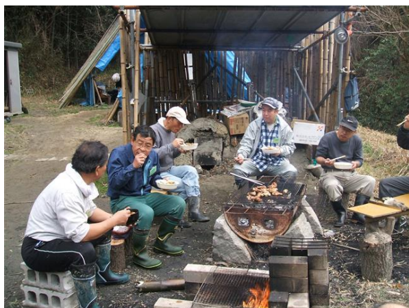
・暖を取りながら昼食時の談笑