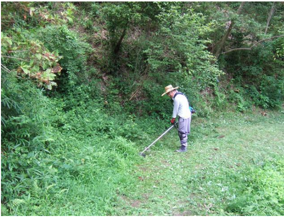
・畦路沿いの機械草刈り

畦路沿いや畑予定地、水田周りの畦に雑草が繁茂しています。刈り払い機での草刈りを行いました。草刈りはこの時期に欠かすことの出来ない活動ですが、雑草が異常なほど、元気に繁茂しています。刈り払い機はプラグの交換や刈り刃の取替え、刃先の研磨、刃元のグリスの補給など小まめに行い、作業の効率が図れるようにしました。また、熱中症に注意して、水分補給と休憩を取りながらの作業となりました。9月ごろまでは活動日ごとの作業となります。