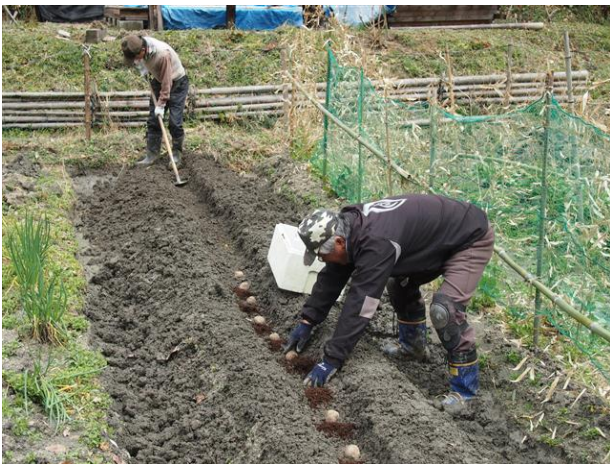
・ジャガイモの溝掘りと植え付け

ジャガイモの植え付けを行いました。今年はキタアカリの種イモを10kg購入しました。有志が事前に用意した半切りのジャガイモに灰を付着させた約120個を植えました。畝をレーキで均して中央部に三角ホーで溝を作り、約30cm間隔で灰付着部を下にして、間に堆肥一握りほどを施しました。その後に土を被せて、軽い目に鍬で押さえました。雨後で土が水分を含み粘性を持っていたことで、足元を気にしての作業となりました。これから芽摘みや土寄せを行い、6月ごろには収穫できるでしょう。