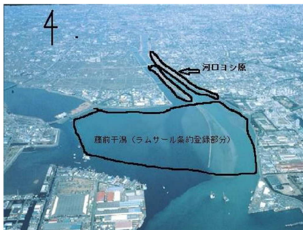
伊勢湾側上空から見た藤前干潟と河口ヨシ原

私たちが通常活動の場としている藤前干潟は、名古屋港の奥、庄内川・新川・日光川の河口部に位置する。干潟部分は、瀬戸・多治見などの陶土地帯に水源をもつ庄内川が運んだ粒子の細かい泥からなり、かつては伊勢湾奥に広大に広がっていた干潟（『万葉集』に「あゆち潟」として記載）の最後の残存部分となっている。1980～90年代にこの干潟が名古屋市のごみ処分場の予定地となり、当会をはじめとする市民の粘り強い活動によって計画中止（1999年）・保全に至ったことは周知のことである。現在は国指定鳥獣保護区・ラムサール条約登録地（2002年登録）として保全されている。