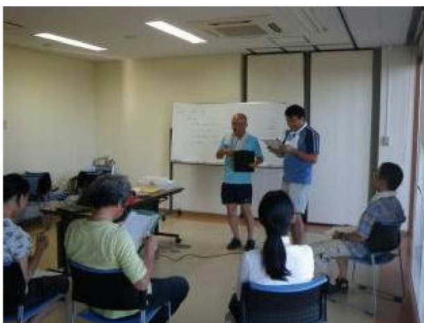
(写真下) 各自のオリジナルプログラムの発表