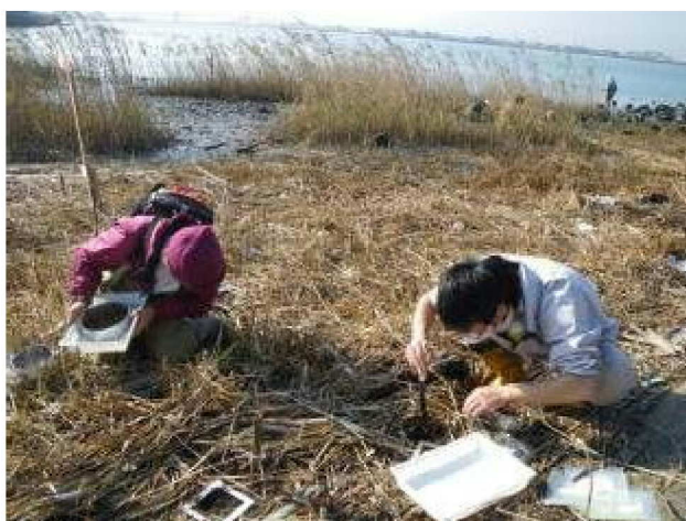
カワザンショウ類の調査風景

に生息している。カワザンショウガイ Assimineia japonica のほかに、クリイロカワザンショウ、ヒラドカワザンショウ、ムシヤドリカワザンショウ、ヨシダカワザンショウなど数種があり、乾燥度に応じて分布しているわけだが、その内で最も水面から遠いところに住んでいるのがヨシダカワザンショウである。水面から最も遠いということは最も陸域に近いということであり、埋め立て等の人間活動の影響を受ける可能性が高い。工事開始前から工事中、昨年2月の工事完了後と、6回にわたって生息状況の調査を行った結果、危惧した通り、工事後にヨシダカワザンショウが見られなくなった。これに関しては、一時的な攪乱による変化で環境が安定すれば戻ってくるという意見もあり、もう少し長期的にデータを集めていくしかないが、とにかくこれまであまり注意しなかったヨシ原にも、特有の生態系があり、無配慮な開発や破壊行為がなされないよう保全をはかるべきだという認識が共有された。この調査は事業主体である国土交通省庄内川出張所とその委託をうけたコンサルタント会社、管理者である環境省名古屋自然保護官事務所、そして当「藤前干潟を守る会」が合同で実施し、その結果を翌年度の工法に反映させるなどの成果を得た。