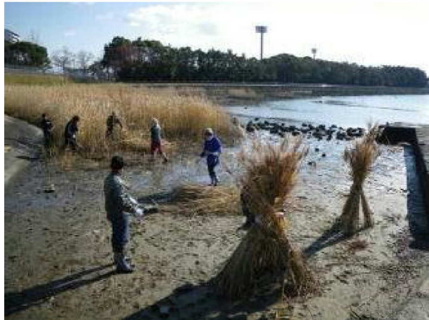
刈ったヨシを束ねて運び出す

ヨシ笛講習（前述事業2）で指摘された「このヨシは使えない」という状況を何とかしようということで、まずは定期的な手入れをすることにした。夏の間成長したヨシを冬に刈り取り、翌年新しく生えてくるヨシの成長する空間を確保してやることで、太く強い茎が作られる。かつては広く