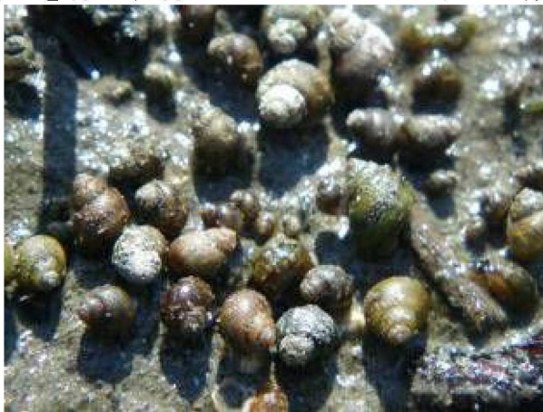
ヨシ原のカワザンショウガイ類

Assiminea 」の生息状況について確認した。干潟に生息する小型の巻貝類で、生態上の特徴として、水面からの距離（乾燥度）に応じて種ごとのすみ分けが行われていることがある。大きさ（殻長）は大きくても5mm程度、茶色を基本として目立つ模様や形態的な特徴も少なく、見落としがちな生物であるが、意識して見るとヨシの根元や泥の上などにそれこそ無数