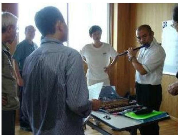
(写真下) ヨシ笛の演奏実演