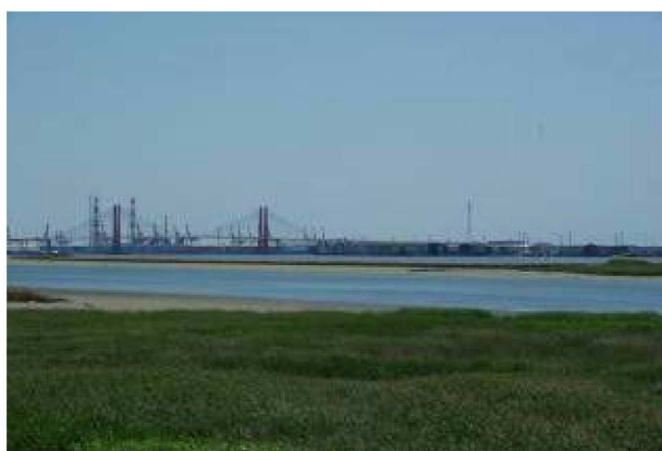
庄内川左岸堤防上からのヨシ原