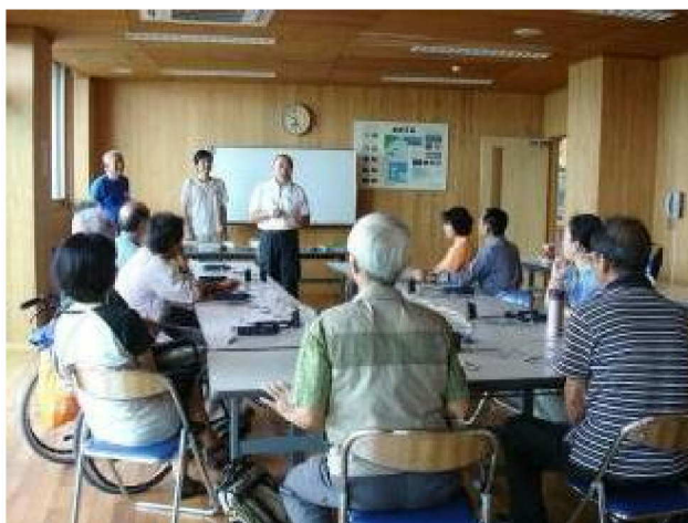
(写真上) ヨシ文化についての説明

参加者は午前10名、午後11名の延べ21名。穴の開け方から音階の調整、音の出し方など、丁寧に教えていただき、ヨシの持つ可能性の広さを実感した。ただ、残念な点は、私たちのフィールドにあるヨシは笛として使用できないということである。笛としての使用に耐えるためには、ある程度太さと堅さが必要で、それはそのために条件を整えて育成しなければならないが、庄内川河口ではそのような管理がなされていない。そのため細く強度のないヨシになっており、実用に適さないとのことであった。私たちがヨシ原をどのように利用していくかということも含め、今後の展開に多くの示唆を得た講座となった。