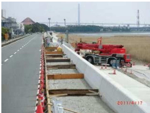
堤防工事の様子（庄内川左岸）

1959年の「伊勢湾台風」での甚大な被害を受けて直後に整備されたものであるが、建設後50年を経て老朽化が目立つようになり、また昨今の耐震性能強化の流れを受けて改修されることとなった。改修工事の事業者は国土交通省の庄内川河川事務所であり、工事箇所が鳥獣保護地区内であることから、管理者の環境省中部地方事務所と調整のうえ進められた。ちょうど、この地域に関しては、保全の経緯