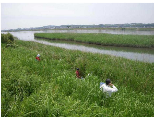
(写真上) ヨシ原の消滅した長良川の右岸