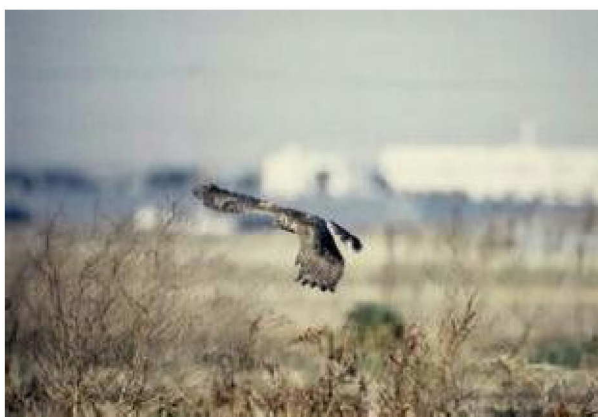
木曾岬干拓地のチュウヒ

数年前から、庄内川護岸堤防の改修工事計画が具体化してきたが、その際に堤内地のヨシ原部分への工事の影響を検討していく中で、これまで知られていなかった生物相や生態が明らかになり、ヨシ原の保全を訴えていく必要性を認識し、今回の事業につながったものである。この護岸堤防は、